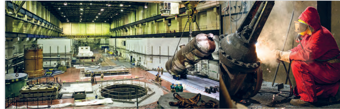
Dekontaminierungsarbeiten in der Reaktorhalle von Greifswald. Rechts im Bild ein Dampferzeuger. Bevor er ins Zwischenlager kommt, wird er zersägt.

Beliebige Grenzwerte, fehleranfälliges Verfahren, mangelhafte Kontrollen